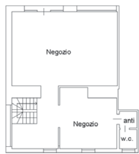
PIANO TERRA H= 3,80m